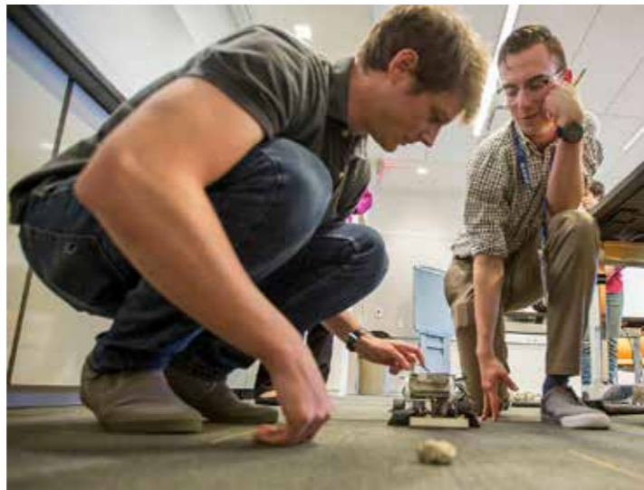
Forskare på NASA bygger och testar många modeller av fordon innan de bygger ett fordon i full skala.

Sedan 2004 har självstyrande fordon befunnit sig på Mars. De kallas Mars Rovers. USA har fram till 2021 sänt upp fem olika fordon och detta år landade även en kinesisk Rover på Mars yta.