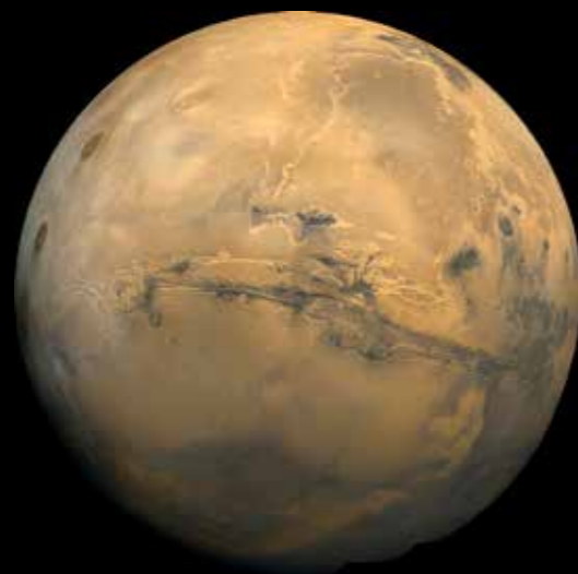
Bilden av Mars är tagen av en rymdsond som skickades upp i rymden år 1975. Bilden består av över 100 hopsatta fotografier.